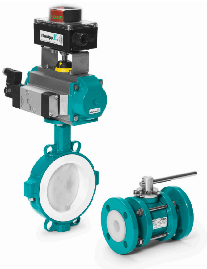
Bianca, дисковый затвор с футеровкой из PTFE TLBVA23, шаровой кран с футеровкой из PFA

Поворотные дисковые затворы InterApp по всему миру зарекомендовали себя на заводах и цехах по производству серной кислоты - в Южной Африке, Намибии, Польше, Австралии и др.